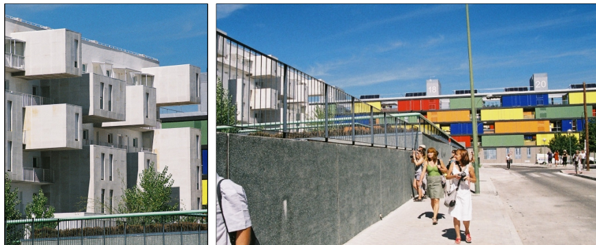
Fot. 8 i 9. Zrównoważone domy społeczne Carabanchel Carabanchel 20 i 21: C20 – głęboko urzeźbiona elewacja budynku i C21 – kolorowe poziomo przesuwne żaluzje są efektem technicznych innowacji [Wojtyszyn 2010]

Phot. 8 and 9. Sustainable social houses Carabanchel Carabanchel 20 and 21: C20 – deeply sculptured facade of the building and C21 – colorful horizontally sliding shutters are the result of technical innovation [Wojtyszyn 2010]