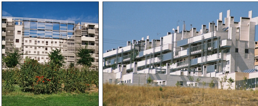
Fot. 3 i 4. Zrównoważone domy społeczne Carabanchel 19 i 11: C19 – elewacyjny ciąg regulowanych żaluzji poziomych i C11 – mauretański system wentylacji kominowej kreują architekturę budynków [Wojtyszyn 2010]

Phot. 3 and 4. Sustainable social houses Carabanchel 19 and 11: C19 – string elevation adjustable horizontal blinds and C11 – Moorish tower ventilation system create the architecture of buildings [Wojtyszyn 2010]