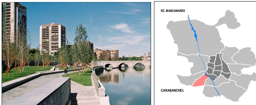
Fot. 1. Nowe tereny zieleni nad rzeką Manzanares, Madryt [Wojtyszyn 2010] Phot. 1. New green coastal areas of the river Manzanares [Wojtyszyn 2010]