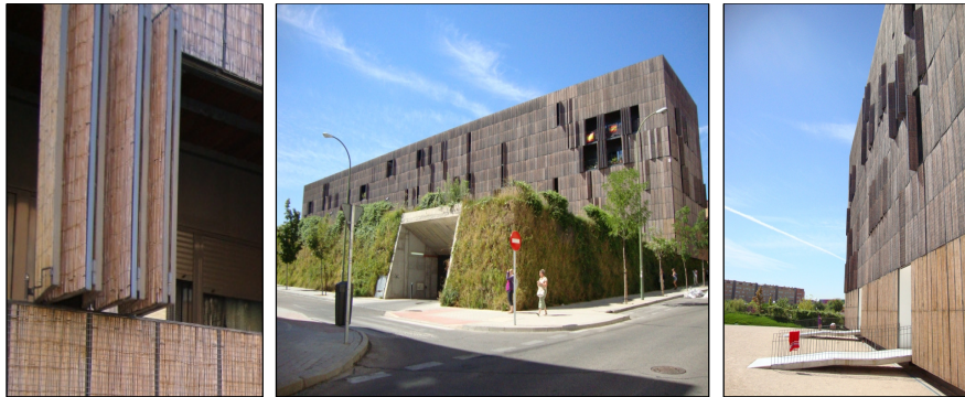
Fot. 5, 6 i 7. Zrównoważony dom społeczny Carabanchel 16 – Bambusowe żaluzje ruchome kreują architekturę elewacji budynku [Wojtyszyn 2010] Phot. 5, 6 and 7. Sustainable social house Carabanchel 16 – Bamboo, movable shutters create the architecture of the building facade [Wojtyszyn 2010]

Carabanchel 20 – W projekcie architektury budynku jego rdzeń w kształcie litery L, usytuowany na skraju działki przy głównej ulicy i lasu sosnowym, utworzył po przeciwnej stronie dynamiczne, otwarte wnętrze z głęboko urzeźbioną elewacją i zielenią prywatnego tarasu ogrodowego na dachu parkingu. Od strony głównej ulicy, przed nadmiernym nagrzaniem mieszkań, chronią zamontowane do elewacji budynku ażurowe filtry. W celu wyciszenia mieszkań w strefie wypoczynkowej i zmniejszenia ich powierzchni komunikacyjnej, do wewnątrz dziedzińca wysunięto pokoje sypialne z postaci odrębnych brył przymocowanych do rdzenia budynku. Konstrukcję budynku zoptymalizowano w sposób zrównoważony stosując uprzemysłowiony system automatycznego montażu lekkich modułów stalowych i wysokiej jakości gotowych elementów aluminiowych. Dzięki temu uniknięto powstawania odpadów i znacznie przyspieszono proces budowy, co istotnie obniżyło również koszty realizacji.