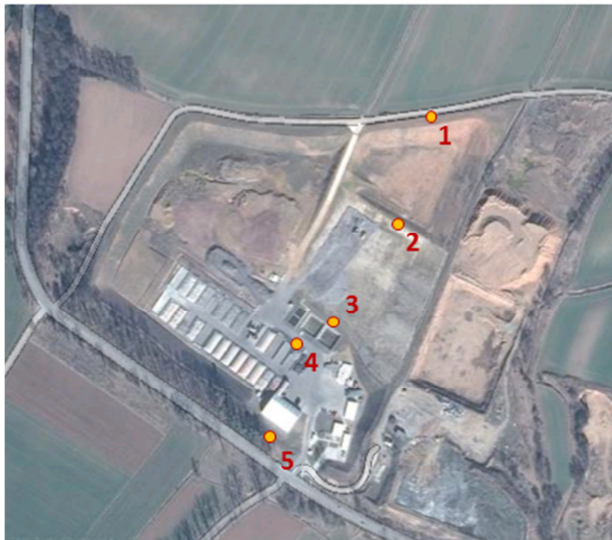
Ryc. 1. Lokalizacja poboru próbek Fig. 1. Sampling location

Miejsca poboru prób zlokalizowano zgodnie z kierunkiem wpływu wód podziemnych (z północy na południe). Lokalizacja miejsc wiąże się z przede wszystkim z możliwością migracji zanieczyszczeń związaną ze spływem wód powierzchniowych i podziemnych. Rycina 2 prezentuje lokalizację punktów monitoringowych. Tabela 1 przedstawia informację nt. punktów pomiarowych.