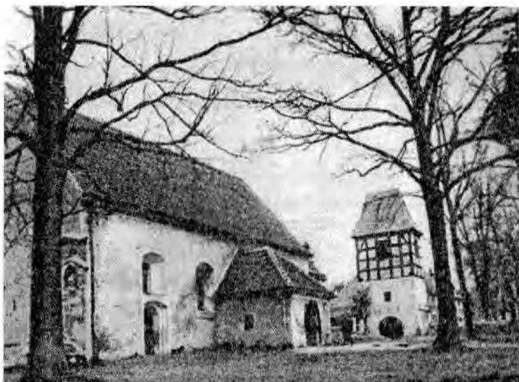
2. Kościół romański św. Andrzeja w Hławie z pierwszej połowy XIII wieku (Miasta polskie w tysiącleciu, t. 2, Ossolineum 1967)

Szprotawę (1260-1960), kiedy to w Hławie odsłonięto pamiątkowy obelisk i ukazały się liczne publikacje na ten temat 3 .