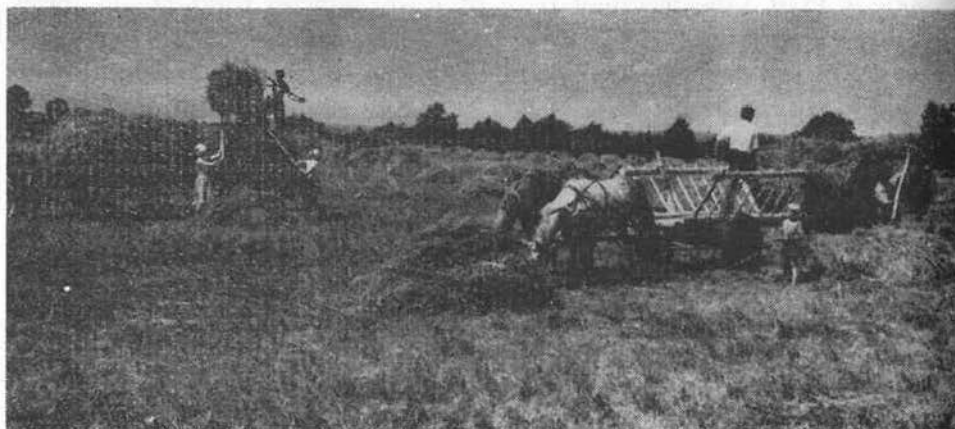
Sianokosy w gospodarstwie indywidualnym — Jeziory, pow. świebodziński

Zasady polityki rolnej w okresie po grudniu 1970 roku określone zostały we wspólnej uchwale Biura Politycznego KC PZPR i Prezydium NK ZSL z kwietnia 1971 roku, a następnie zostały potwierdzone przez trzy kolejne zjazdy partii. Zdynamizowanie produkcji rolnej we wszystkich sektorach rolnictwa stało się przewodnią myślą przy wypracowaniu zasad polityki rolnej, a zasada kojarzenia wzrostu produkcji rolnej z socjalistycznymi przeobrażeniami w rolnictwie i na wsi, rozumiana jako ciągły proces, stanowi o istocie polityki rolnej partii i państwa w latach siedemdziesiątych.