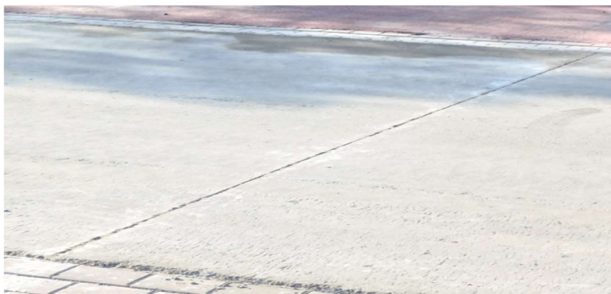
Fot. 2. Nawierzchnia z RCC – nacięcia i szczeliny Phot. 2. Paving with RCC - cuts and crevices