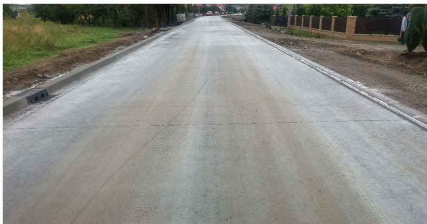
Fot. 1. Nawierzchnia z betonu wałowanego – Wisze Krosno Phot. 1. Paving with roller compacted concrete - Wisze Krosno