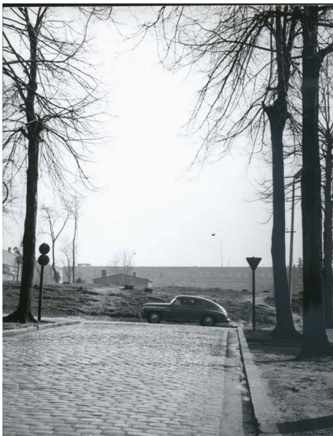
Ryc. 5. Zachodnia część cmentarza bezpośrednio przed budową przedłużenia ul. Fornalskiej.

Ponieważ cmentarz postanowiono zamienić w park, w 1965 roku Prezydium Miejskiej Rady Narodowej przyjęło jego projekt koncepcyjny, zaś w marcu 1966 roku gotowa była pełna dokumentacja techniczna przedsięwzięcia opracowana przez Wojewódzkie Biuro Projektów i Zespół Usług Projektowych 31 . Projekt opierał się na podziale całego obszaru na sektory: wypoczynkowo-spacerowy, rozrywkowy i sportowy 32 . Budynek dawnego krematorium, wchodzący w skład części wypoczynkowo – spacerowej, proponowano przeznaczyć na ekspozycje przyrodnicze lub plastyczne i wydzielić w jego podziemiach szalet. Obok, jako że ten teren był dobrze nasłoneczniony, planowano założenie piaskownic. Od strony ul. Staszica zlokalizowano