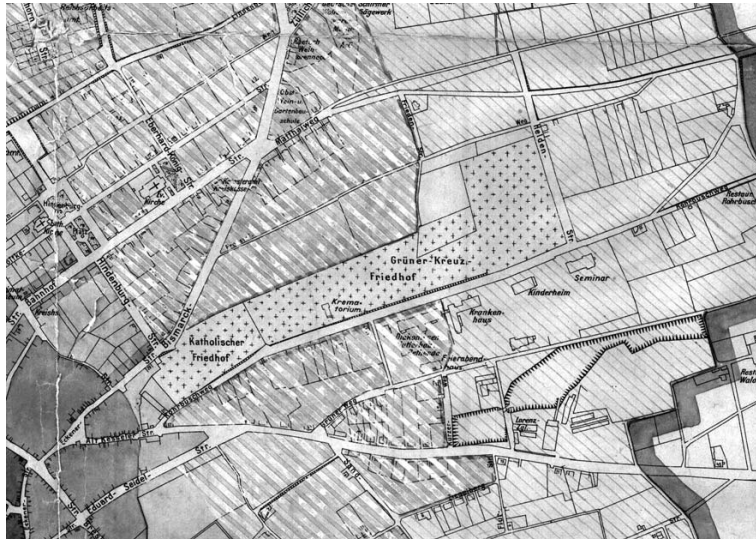
Ryc. 1. Cmentarz na planie Zielonej Góry z 1926 roku.