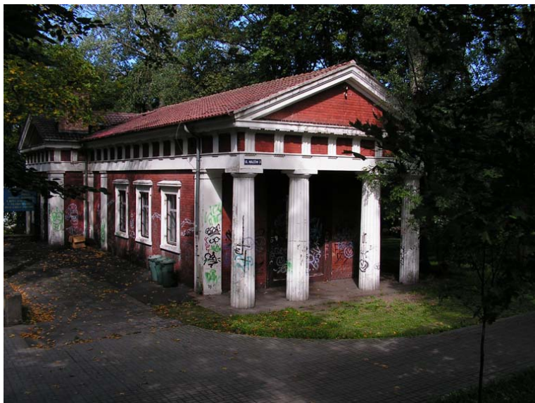
Ryc. 8. Budynek dawnego krematorium. Stan obecny.

Budynek dawnego krematorium zachował się właściwie w niezmiennym stanie. Jego obecny kształt jest efektem dobudowania do wcześniejszej kaplicy pomieszczeń krematoryjnych. Kaplicę zbudowano na planie prostokąta w formie nawiązującej do antycznej greckiej świątyni. Jednokondygnacyjny budynek posiada dwuspadowy dach pokryty dachówką. Ściany wzniesione z czerwonej cegły ozdobione są architektonicznymi elementami dekoracyjnymi. Pilastry oraz belkowanie, na które składa się architrav i pas z tryglifami, wykonano w tynku. Tympanon o pustym polu wewnętrznym obramiono gzymsem. Główne wejście do budynku usytuowane od strony ul. Wazów zaznaczono kolumnadą. Elewacje boczne określają po trzy otwory okienne z profilowanymi obramieniami. Część krematoryjna pochodząca z lat dwudziestych XX wieku przylega do północnej ściany kaplicy tworząc układ w kształcie litery t. Dwukondygnacyjny obiekt, przykryty dwuspadowym dachem, powiela formę stylistyczną kaplicy. Przy zachodniej elewacji znajduje się parterowa dobudówka pełniąca funkcję tarasu.