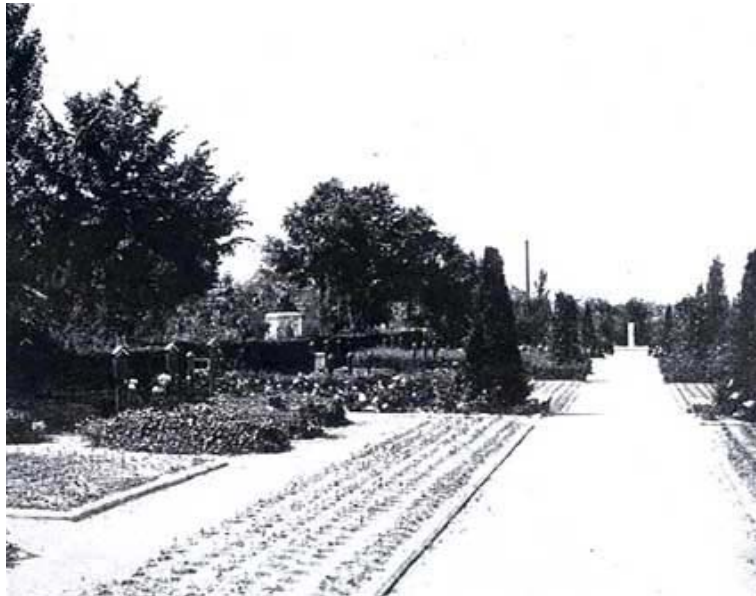
Ryc. 2. Cmentarz zasłużonych.

razem ulegający największym przeobrażeniom 8 . Postanowiono utworzyć na nim Cmentarz Pamięci (niem. Ehrenfriedhof). Wiadomo, że 14 grudnia 1914