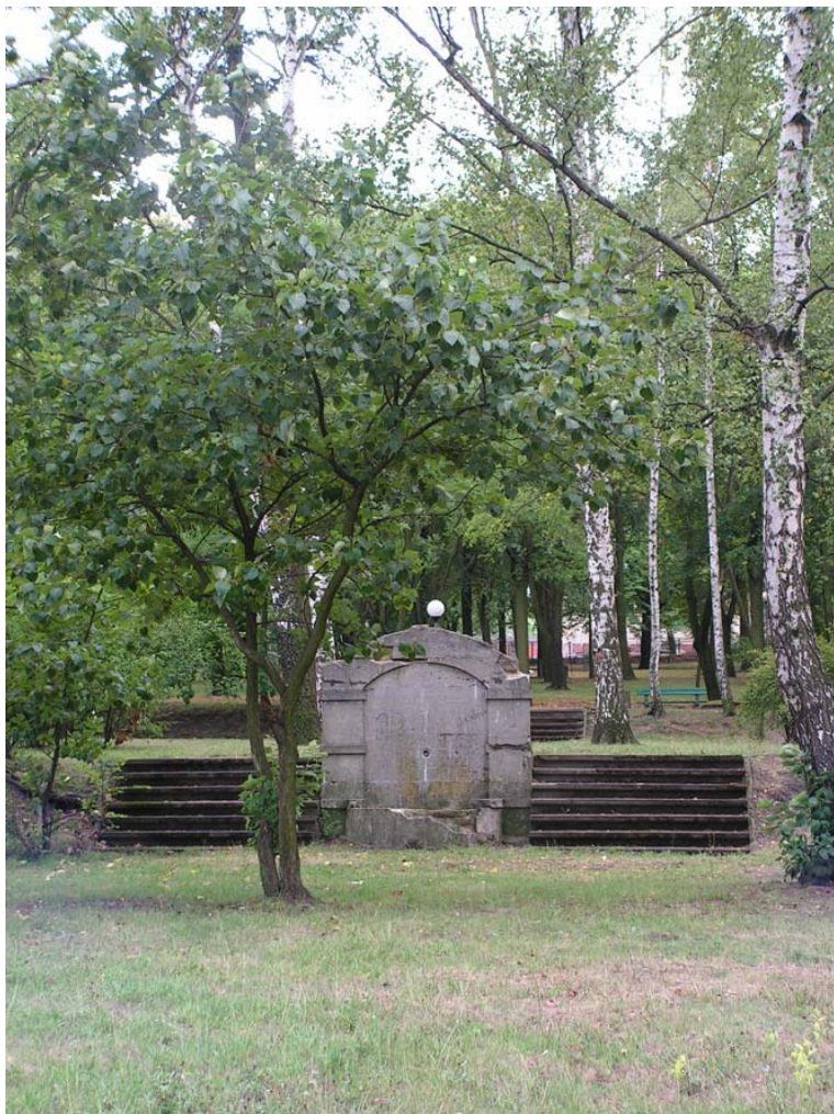
Ryc. 9. Punkt poboru wody. Stan obecny.