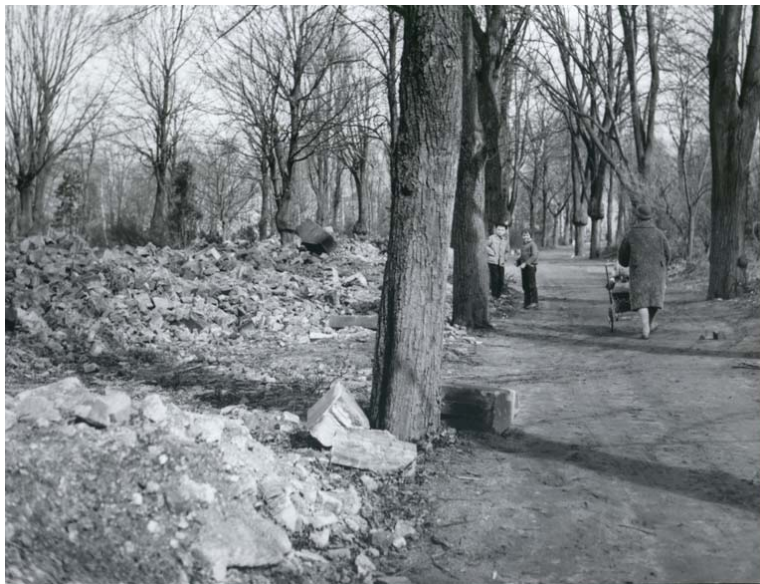
Ryc. 4. Likwidacja grobów.

na, nazwiska, daty urodzin i śmierci. Spisano odpowiednio w sektorze C1 – 240 zmarłych, w C – 661, w D – 675, w E – 329. Razem 1905 zmarłych, w zdecydowanej większości o niemieckich nazwiskach. Lista wydaje się być niekompletna, ponieważ brakuje spisu z sektorów A i B. Wprawdzie dokument nie ma datowania, ale najprawdopodobniej powstał na początku lat sześćdziesiątych – przemawia za tym uwaga zawarta na stronie tytułowej części graficznej opracowania, która informuje, że sporządzono ją na podstawie podkładu geodezyjnego projektu parku.