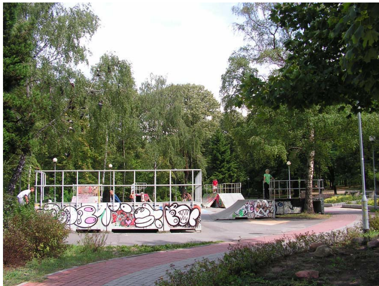
Ryc. 7. Skatepark.

Park zajmuje powierzchnię 9,6 ha. Jego rzut zbliżony jest do kształtu litery L, z dłuższym bokiem usytuowanym na osi wschód–zachód. Położony jest na zboczu opadającym w kierunku północnym. Różnica wysokości między najwyższą i najniższą położonymi punktami wynosi 14 m (od 156 m n.p.m. na szczycie do 142 m n.p.m. u podnóża). Większa część terenu, ukształtowana jeszcze przed wojną, zachowała układ tarasowy składający się z kilku pięter poprowadzonych równoległe do głównych alei. Wzdłuż południowej granicy w jej środkowym odcinku znajduje się niewielka skarpa zanikająca z obu stron i dalej – w kierunku zachodnim – nieco większa. Od strony Placu Piłsudskiego około 3-metrową skarpe uformowano przy niwelacji terenu podczas budowy ulicy. Granica północna zaczyna się skarpe przy ul. Chrobrego, która na wysokości ul. Mieszka I zanika. Znaczna różnica wysokości pojawia się w dalszej części północnej granicy i jest częściowo niwelowana przez naturalną skarpe, a częściowo przez ceglany mur oporowy. Od strony ul. Staszica teren parku jest wyniesiony. Naturalnie ukształtowana skarpa w części przylegającej bezpośrednio do ulicy jest umocniona betonowymi prefabrykatami.