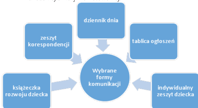
Rys. 2. Wybrane formy komunikacji szkoły z rodziną na podstawie francuskiej szkoły freinetowskiej.

Źródło: opracowanie własne na podstawie: M. Kędra, Włączanie rodziców w edukację dzieci , Warszawa, s. 6-7.