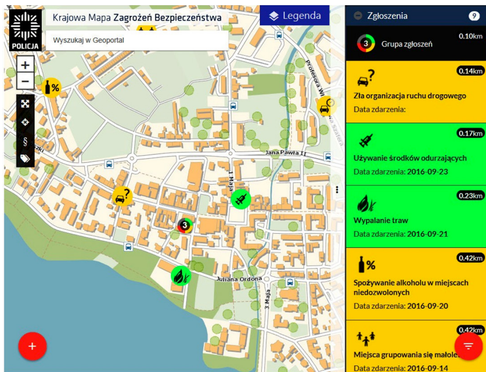
Rysunek 3. Aplikacja Krajowej Mapy Zagrożeń Bezpieczeństwa z uwzględnieniem wybranych kategorii przestępstw