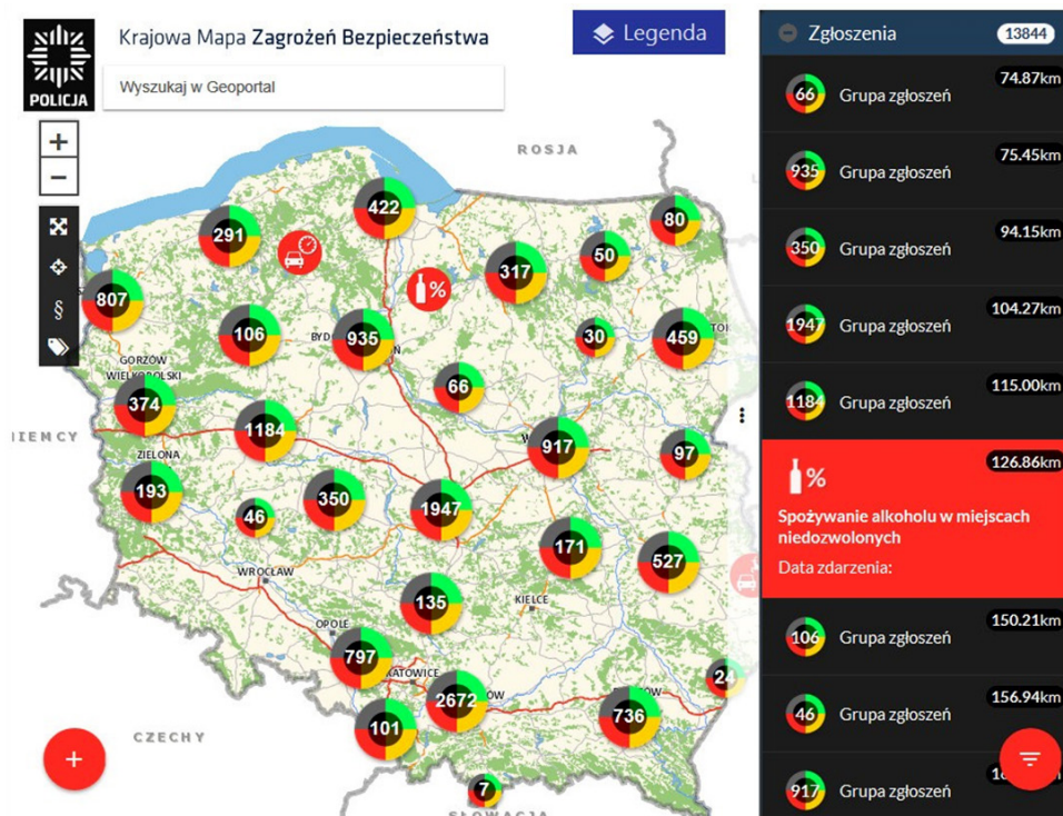
Rysunek 2. Aplikacja Krajowej Mapy Zagrożeń Bezpieczeństwa, dostępnej w internecie Źródło: http://zachodniopomorska.policja.gov.pl/sz/aktualnosci/prewencja-i-profilaktyk/mapy/5975,Mapa-zagrozen-bezpieczenstwa.html [dostęp: 23.09.2016].

Informacje prezentowane na mapach uwzględniają zarówno wybrane kategorie przestępstw i wykroczeń, jak i zagrożenia, które w subiektywnym odczuciu mieszkańców negatywnie wpływają na ich poczucie bezpieczeństwa. Strona nie służy do zgłaszania potrzeby pilnej interwencji Policji. Każde naniesione na mapę zagrożenie wywoła, po sprawdzeniu, odpowiednią reakcję Policji (rys. 2).