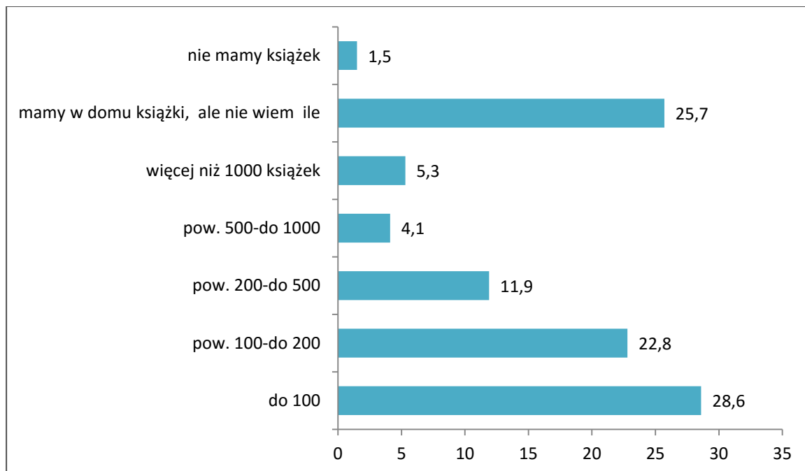
Wykres 7.1. Wielkość księgozbioru badanych studentów (%).

Badając zachowania czytelnicze studentów postanowiliśmy także zapytać o prywatne zasoby książkowe. Dane na wykresie wskazują, iż najmniejszy z przedziałów (do 100 woluminów) wskazało najwięcej badanych – blisko 29%. Ponad ¼ badanych nie potrafiła oszacować liczby zgromadzonych w domu rodzinnym książek.