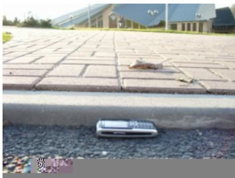
Fot. 1-2. Wysokość progów ścieżki rowerowej sprzeczna z zapisami prawnymi (Zielona Góra) i zgodna z nimi (Wrocław)

Główne elementy sytuujące ścieżki rowerowe są w Polsce regulowane przez w dużej mierze precyzyjne przepisy prawne, jednakże doświadczenie pokazuje, że nie każdy inwestor ich przestrzega, co uwidacznia fot. 1 (vs. fot. 2).