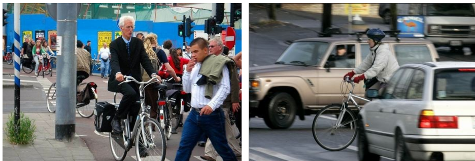
Fot. 7-8. Kolizyjne sytuacje wspólnego korzystania z przestrzeni przez rowerzystów, pieszych i kierowców samochodów

Phot. 7-8. Conflict situations of shared use of space by the cyclists, pedestrians and car drivers