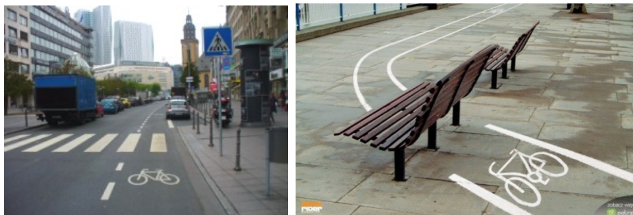
Fot. 3-4. Poprawnie wydzielony pas rowerowy we Frankfurcie nad Menem – czytelny układ, brak przeszkód, dobra nawierzchnia vs. kuriozum przestrzenne Phot. 3-4. Properly separated bike lane in Frankfurt am Main – clear layout, the lack of obstacles, good surface vs. space oddity

Nie bez znaczenia dla komfortu jazdy rowerem jest nawierzchnia ścieżek rowerowych. W Polsce często obserwowana jest metoda budowania ścieżek rowerowych z pol-bruku. Ścieżki budowane z kostki pol-brukowej sprawiają iż rowerzysta poruszający się po nawierzchni z kostki napotyka opory toczenia o 30-40% większe niż w przypadku nawierzchni asfaltowej. Całkowity koszt położenia nawierzchni ścieżki z asfalta-betonu wynosi 31,50 zł/m 2 podczas gdy koszt zakupu kostki „Pol-bruk” to 34 zł/m 2 . Kostka polbrukowa jest też znacznie mniej trwała od asfaltu, przy założeniu zastosowania prawidłowej technologii. Stosownie do art. 28 ust. 3 pkt.1 Ustawy z dnia 26 listopada 1998 r. o finansach publicznych, wydatki publiczne powinny być dokonywane w sposób celowy i oszczędny, z zachowaniem zasady uzyskiwania najlepszych efektów z danych nakładów. Nie ulega wątpliwości, iż stosowanie na drogach rowerowych, zamiast powierzchni bitumicznej, droższej w realizacji i charakteryzującej się niższymi walorami użytkowymi nawierzchni z kostki betonowej, nie ma racjonalnego uzasadnienia i stanowi naruszenie przywołanego przepisu.