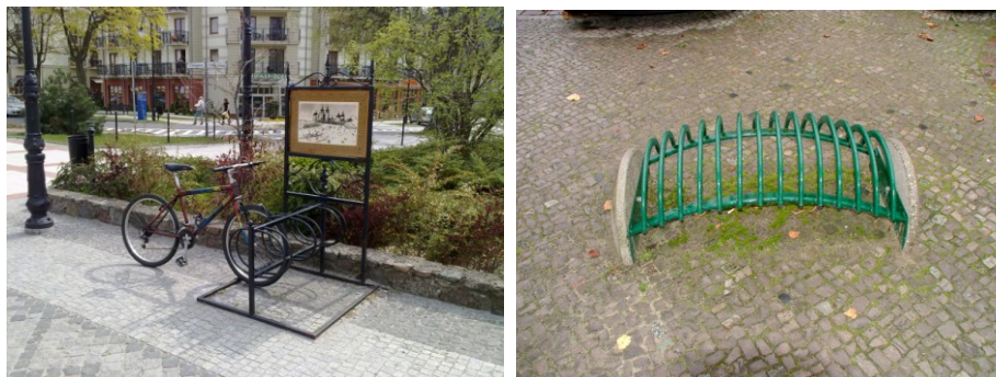
Fot. 9-10. Stojak rowerowy w Świnoujściu (z lewej); bardzo ładny i neutralny krajobrazowo stojak w Fürstenwalde – niestety zapewniający bardzo ograniczoną ochronę sprzętu (z prawej)

wózków dziecięcych lub dla osób niepełnosprawnych. Ważne jest aby kąt nachylenia schodów nie był większy niż 25 stopni.