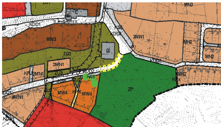
Rys. 1. Fragment miejscowego planu zagospodarowania przestrzennego w rejonie ul. Władysława IV i ul. Niecałej w Zielonej Górze

W związku z planowaną zmianą miejscowego planu zagospodarowania przestrzennego na obszarze Osiedla Braniborskiego, należy zwrócić uwagę na możliwe skutki proponowanych zmian. Zmiany, które budzą największe kontrowersje dotyczą lokalizacji zabudowy mieszkaniowej wielorodzinnej (tereny oznaczone na rys. 1 jako MW4) oraz drogi łączącej istniejącą ulicę Braniborską i ulicę Podgórną, która według projektu ma przebiegać wzdłuż terenu zieleni urządzonej parkowej (rys. 1 – oznaczenia KDD2 i KDD4 oraz żółta przerywana linia pomiędzy KDD2 i KDD4).