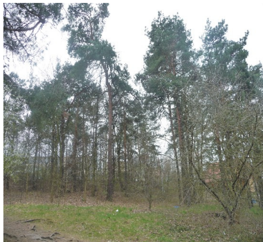
Fot. 2. Drzewa przeznaczone pod wycinkę na obszarach przeznaczonych pod zabudowę i drogę

Phot. 2. Trees marked for felling in areas designated for development and road