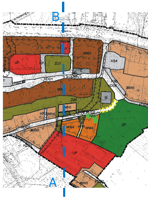
Rys. 3. Fragment miejscowego planu zagospodarowania przestrzennego wraz linią przekroju