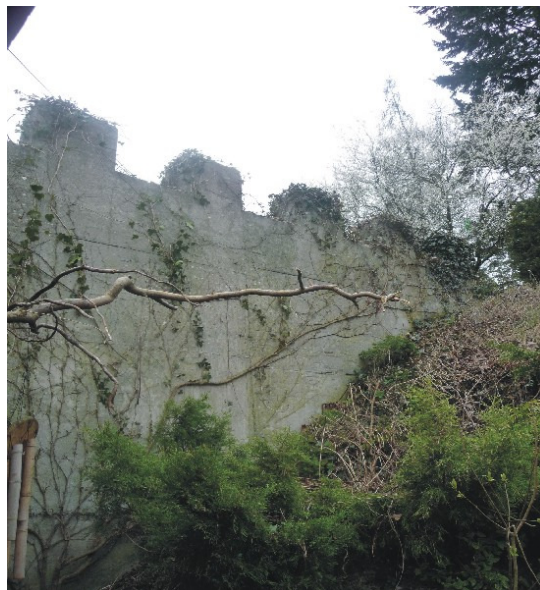
Fot. 1. Mur oporowy wykonany w celu wzmocnienia zbocza przy ul. Braniborska – Władysława IV