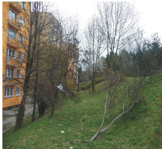
Fot. 4. Spadek zbocza od ul. Braniborskiej w kierunku ul. Władysława IV Phot. 4. Decrease in slope from the Braniborska street toward the Władysław IV street