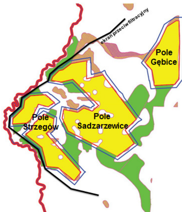
Rys. 2. Wydzielone pola eksploatacyjne: Sadzarzewice, Strzegów i Gębice [Kasztelewicz i in. 2011]