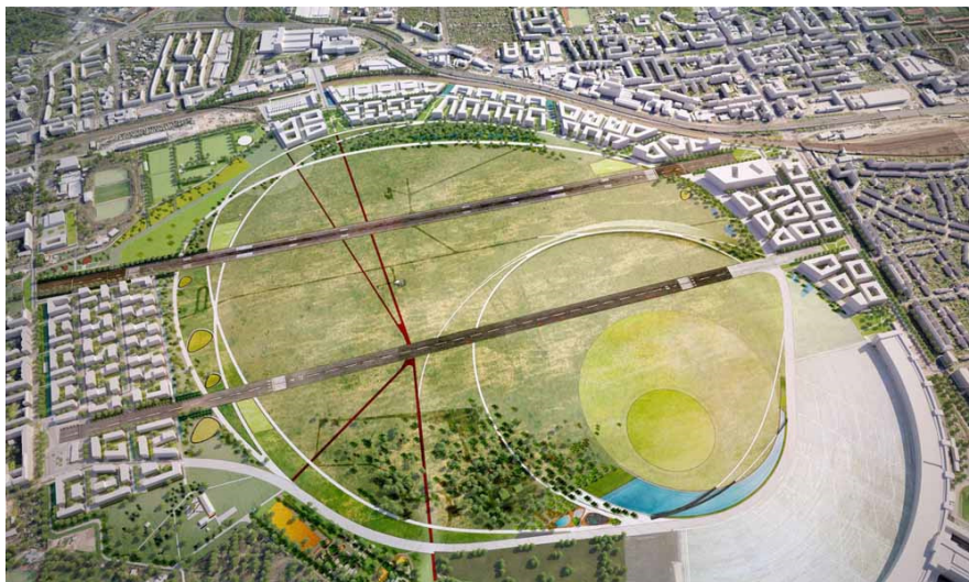
Fot. 1. Master Plan – Park wolności [www.stadtentwicklung.de 18.03.2013r.] Phot. 1. Master Plan – Freedom Park [www.stadtentwicklung.de 18.03.2013r.]