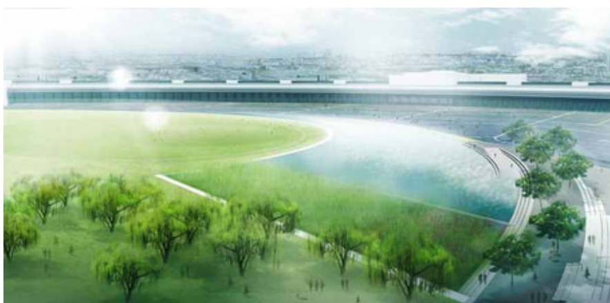
Fot. 1. Cztero-hektarowy zbiornik retencyjny z promenadą widokową. [www.tempelhoerfreiheit.de 20.03.2013r.] Phot. 1. 4-hectare reservoir with the scenic promenade. [www.tempelhoerfreiheit.de 20.03.2013r.]

Zabudowania starego lotniska liczą w sumie 300.000 m 2 i są nadal jednymi z największych na świecie. Od 2009 roku służą jako miejsce targów, festiwalu, eventów. Do tej pory w sumie około sto firm wynajmuje powierzchnię równą 70.000 m 2 . Głównymi najemcami są projektanci, muzycy, przedstawiciele bran-