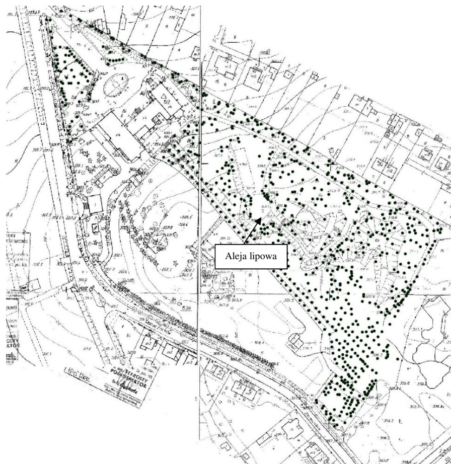
Rys. 1. Schemat rozmieszczenia drzew na inwentaryzowanym obszarze parku Zakonu OO. Kamilianów w Tarnowskich Górach Fig. 1. Location of trees at the Camilian Monastery park in Tarnowskie Góry