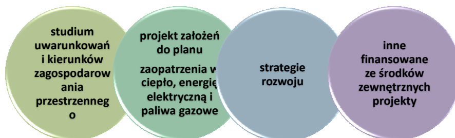
Rys. 2. Zamiast jednego dokumentu strategicznego umożliwiającego rozwój miasta oraz kreowanie jego obrazu i wizerunku, będzie kilka

nych będzie kilka niezależnych dokumentów dotyczących tych samych obszarów działania (ciepło, energia elektryczna i paliwa gazowe).