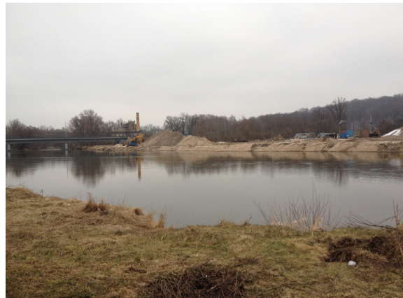
Fot. 2. Widok zakładu eksploatacji kruszywa od strony południowo-zachodniej Phot. 2. View of undertaking exploitation of aggregate from the south-west side

Instalacja do poboru i obróbki kruszywa jest obiektem niezwiązanym trwale z podłożem (semi-mobilnym) – posiada możliwość przemieszczania w obrębie nieruchomości oraz poza nią. Semi-mobilność zapewnia zaplecze transportowe użytkownika instalacji oraz fakt jej wykonania na podporach stalowych lub betonowych, niezwiązanych trwale z terenem. Przyjęte rozwiązania nie pogarszają warunków przepływu wód powodziowych, a jednocześnie – umożliwiają usunięcie zakładu z terenu zagrożonego powodzią podczas wezbrania.