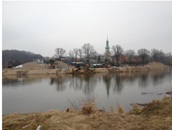
Fot. 1. Widok zakładu eksploatacji kruszywa od strony zachodniej Phot. 1. View of undertaking exploitation of aggregate from the west side