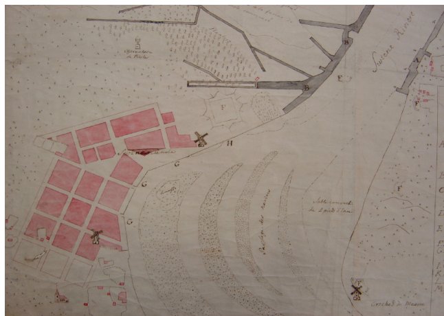
Fot.1. Świnoujście – Plan miasta z 1766r. w zbiorach Stadtbibliothek w Berlinie Photo 1: Świnoujście – city map from 1766 from the collection of Stadtbibliothek in Berlin

Świnoujście to jedna z najpopularniejszych miejscowości nadmorskich w Polsce. Umiejscowiona na dwóch wyspach – Uznam i Wolin stała się jednym z atrakcyjniejszych ośrodków turystycznych. Wyspa Uznam to część miasta wraz z nadbrzeżem promów pasażerskich i białej floty, parkiem zdrojowym, dzielnicą uzdrowską zabudowaną pięknymi XIX-wiecznymi, zabytkowymi kamienicami. Wschodnia część miasta położona na Wolinie to głównie dzielnica przemysłowo-portowo-magazynowa. Gospodarczo miasto zostało więc ukształtowane przez dwie funkcje: portowo-handlową oraz turystyczno-uzdrowską. Historycznie natomiast początki osadnictwa na tym obszarze sięgają okresu IX wieku, a w okolicach ujścia Świny nawet wcześniej. Do 1750 roku Świnoujście było luźno przestrzennie ukształtowaną wioską, dopiero po tej dacie i wykonaniu projektu zagospodarowania miasta w 1765 roku Fryderyk Wilhelm II nadał mu rangę miasta prywatnego, królewskiego [Piskorski 1983, Biranowska-Kurtz 1988].