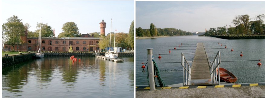
Fot.2. Widok z wody na zabudowania portowe, oraz widok na wodę. Stan z roku 2005 (Institut für Landschaftsplanung Technische Universität Berlin) Photo 2: The view of the port buildings and the view from the side of port buildings of water. State from 2005 (Institute of landscape development, Berlin University of Technology)

townia z wieżą z masywnej czerwonej cegły będąca pod ochroną konserwatora zabytków. Dodatkowo miejsce zajmują budowle nie objęte ochroną konserwatora takie jak zabytkowy żuraw, trzy podzielone arsenały i budynek typu ryglowego. Stan wszystkich obiektów z punktu techniczno-budowlanego jest w większości zły i w obecnym stanie nie nadają się one do użytku. Od roku 1990 kiedy teren ten został opuszczony przez wojska rosyjskie, zabudowania zaczęły ulegać przyspieszonemu niszczeniu. Należały niezwłocznie poddać je pracom remontowym, ponieważ stanowią ważny, interesujący architektonicznie, historycznie i zabytkowo, potencjał powierzchniowy.