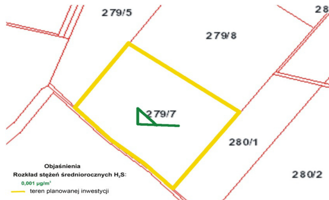
Rys. 4. Rozkład stężeń średniorocznych H_2S w projektowanej kompostowni (skala 1:5000)

Fig. 4. The distribution of average annual concentration of H_2S in the proposed composting plants (scale 1:5000)