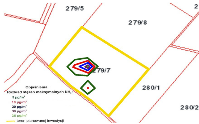
Rys. 3. Rozkład stężeń maksymalnych \text{NH}_3 w projektowanej kompostowni (skala 1:5000)

Fig. 2. The distribution of average annual concentration of \text{NH}_3 in the proposed composting plant (scale 1:5000)