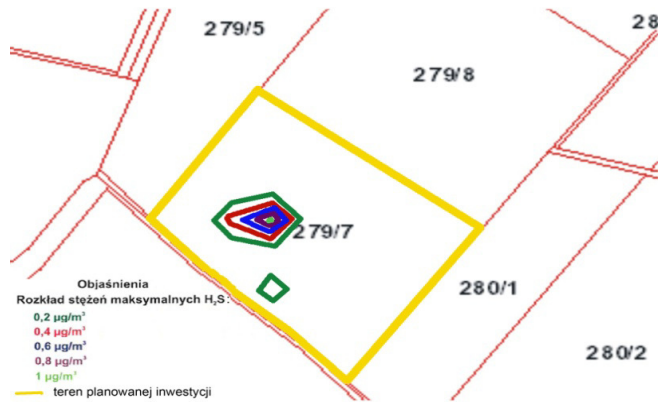
Rys. 5. Rozkład stężeń maksymalnych H_2S w projektowanej kompostowni (skala 1:5000)

Fig. 4. The distribution of average annual concentration of H_2S in the proposed composting plants (scale 1:5000)