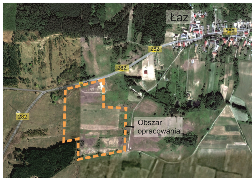
Rys. 1. Lokalizacja obszaru badań [na podst. www.maps.google.pl , 2013] Fig. 1 Location of the research area [based on www.maps.google.pl , 2013]

Teren planowanej inwestycji znajduje się w miejscowości Łaz, położonej w zachodniej części Polski, we wschodniej części województwa lubuskiego, ok. 16 km na zachód od Zielonej Góry. Jest on ograniczony od strony północnej drogą krajową nr 282, z pozostałych stron graniczy z przyległymi działkami (grunty orne od strony wschodniej i zachodniej, tereny leśne i droga gruntowa od strony południowej). Szczegółową lokalizację przedstawiono na rys. 1.