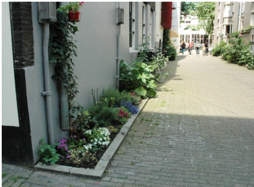
Fot. 1 Roślinność zasilana wodą deszczową, Amsterdam [Domanowska 2012]

temów stwarzają zyski, jakie ludzie czerpią z funkcjonowania ekosystemów. Tu zawarte są zarówno zyski zaopatrujące, regulacyjne, kontrolujące i kulturowe. Usługi ekosystemów utrzymują jakość życia na Ziemi.” (Millennium Ecosystem Assessment (MA), United Nations Environment Programme, 2005). Pojęcie usług ekosystemów doczekało się w literaturze przedmiotu wielu innych definicji, jednakże wszystkie z nich kładą nacisk na to iż środowisko przyrodnicze daje nam zyski, które możemy przeliczyć na pieniądze.