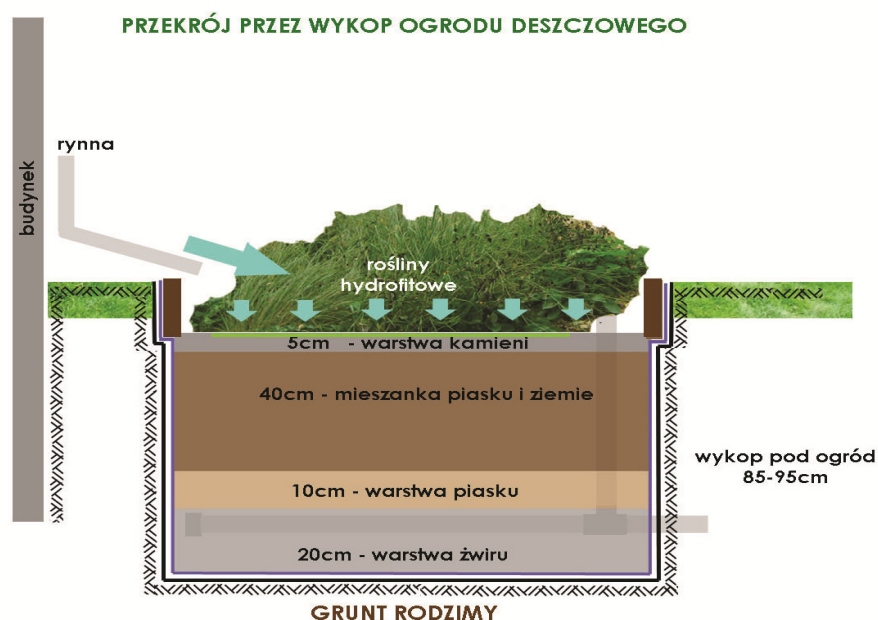
Rys. 1 Przekrój przez ogród deszczowy w gruncie, z uszczelnieniem dna i rurą podłączaną do kanalizacji [Domanowska dla Fundacji Sendzimir]

zminimalizuje konieczność kupowania rur doprowadzających do niego wodę. Skrzynia z roślinami powinna być lekko oddalona od ściany budynku. Zalecana odległość to minimum 30cm. W trakcie doboru miejsca na ogród deszczowy warto zwrócić uwagę by jego usytuowanie nie przeszkadzało w dostępie do urządzeń technicznych przy budynku (np. kratak wylotowych czy skrzynek z instalacją elektryczną). Ważne by nie postawić pojemnika z roślinami na włązie od systemu kanalizacji. By określić wielkość ogrodu jaki jest nam niezbędny należy dokonać pomiaru powierzchni dachu budynku z jakiej odprowadzana jest woda do rynny, z której woda zasila pojemnik z roślinami. Założyć można, że wielkość ogrodu powinna wynosić około 2% powierzchni dachu, z którego odprowadzana jest woda.