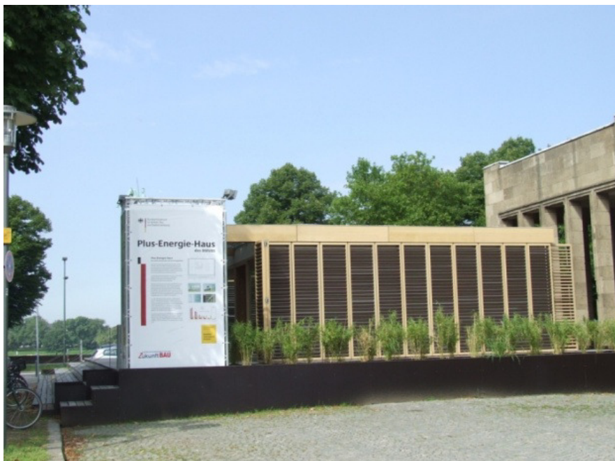
Fot. 2 Ogród deszczowy w Dusseldorfie [Domanowska 2012] Phot. 2. Rain garden in Dusseldorf [Domanowska 2012]

Ogród deszczowy jest terminem powszechnie używanym do określenia nasadzenia roślin w gruncie bądź pojemniku, które usuwają zanieczyszczenia z przepływającej wody deszczowej zbieranej z powierzchni dróg, placów i dachów [Śmietańska 2012]. Przykład takiego ogrodu przedstawiono na fot.2. Ogrody deszczowe powodują również zmniejszania odprowadzania wody z powierzchni nieprzepuszczalnych do kanalizacji, zwiększając w ten sposób retencję wód, czyli zatrzymywanie wody w krajobrazie.