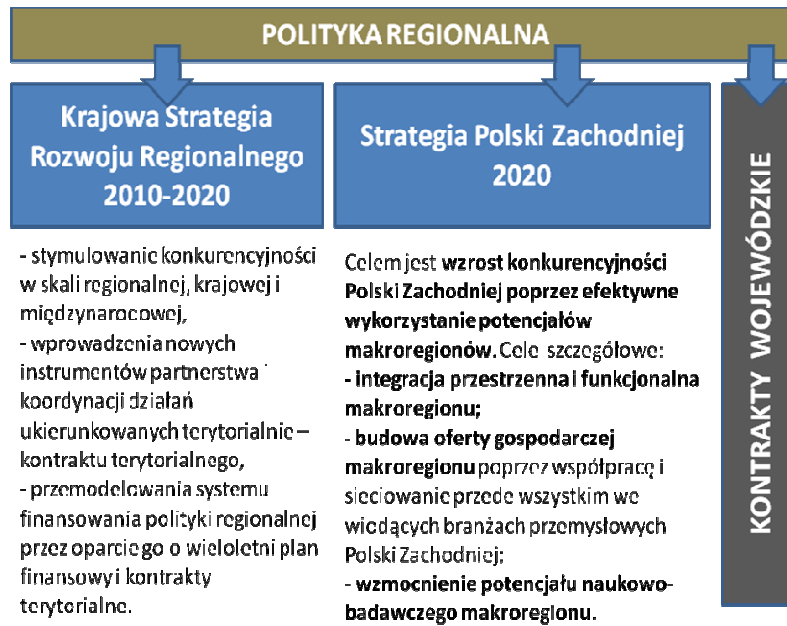
Rys. 4. Schemat układu dokumentów w polityce regionalnej na poziomie województwa lubuskiego