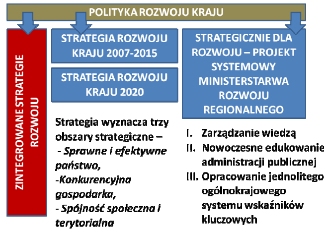
Rys. 2. Schemat układu dokumentów strategicznych w polityce rozwoju kraju Fig. 2. Scheme of strategic documents in the policy development of the country