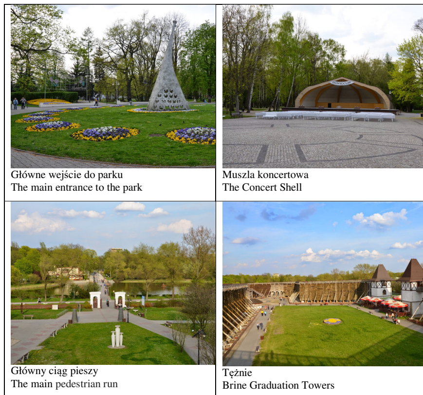
Fot. 1. Park „Solanki” w Inowrocławiu [Kroniki Inowrocławskie 2015] Phot. 1. The Spa Park „Solanki” in Inowrocław [Kroniki Inowrocławskie 2015]

W XIX-wiecznej idei urządzenia parku (I faza budowy parku zdrojowego) dominował geometryczny układ dróg i ścieżek podporządkowany osi północ-południe podkreślonej zdwojoną aleją wysadzaną drzewami, na której dominował budynek łaźni. Podkreślały go partery kwiatowe o rozwiniętych geometrycznie kształtach. Drogi okalające park, prowadziły w północnozachodniej części do warzelni soli znajdującej się po drugiej stronie torów kolejowych. Najstarsza część parku objęta jest ochroną konserwatorską i zawiera się w strefie A ochrony uzdrowiskowej.