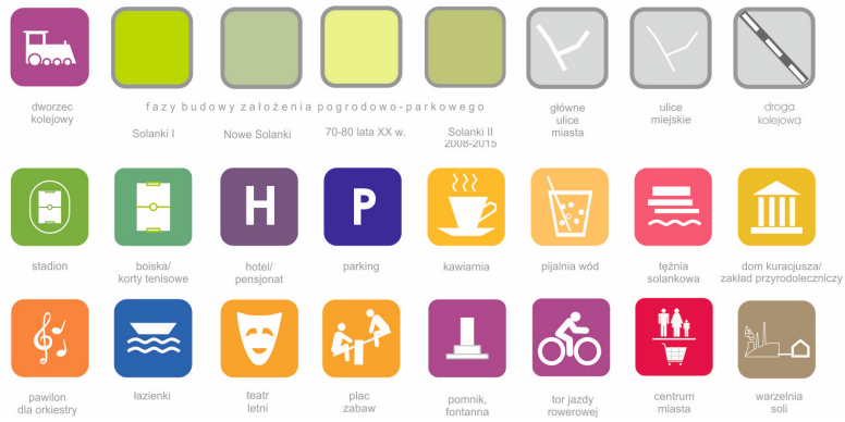
Rys. 1. Schemat Parku Zdrojowego z wykazem funkcji występujących na jego terenie Fig. 1. Diagram of the Spa Park with the list of features present on its territory