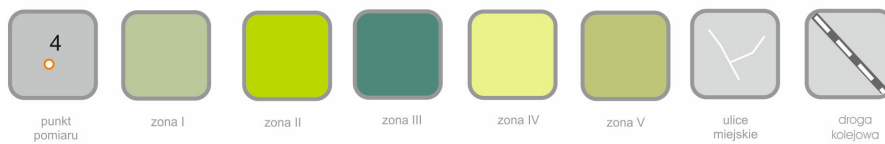
Rys. 3. Schemat Parku Zdrojowego z wydzielonymi pięcioma podobszarami – strefami jednolitego zagospodarowania i lokalizacją punktów pomiarowych hałasu Fig. 3. Schema of the Spa Park with segregated into five areas – zones of uniform development and location of noise measurement points