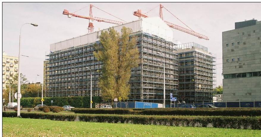
Fot. 1. Biurowiec Green Day we Wrocławiu, Budowa [Wojtyszyn 2013] Phot. 1. Green Day office building in Wrocław, Construction [Wojtyszyn 2013]

Na wstępie należy zauważyć, że cykl życia budynku rozpoczyna się wraz z powstaniem w fabryce pierwszej cegły lub na placu budowy każdego elementu, z którego jest on konstruowany. Najkorzystniej byłoby gdyby elementy budowlane były tworzone przede wszystkim przez miejscowych producentów z materiałów pochodzenia lokalnego. Ograniczamy w ten sposób zarówno ekonomiczne, jak i ekologiczne koszty transportu – zwłaszcza samochodowego bezpośrednio związanego z dostawą materiałów budowlanych na budowę.