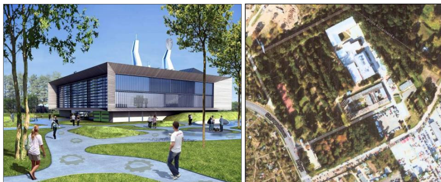
Fot. 4. Kampus Badawczo – Edukacyjny Wydz. Inżynierii Środowiska Politechniki Wrocławskiej – PWr, Projekt i Lokalizacja [www.iko.pwr.wroc.pl]

panie z gruntu: energii cieplnej w okresie zimy i darmowej energii chłodniczej latem ( free cooling ) oraz ogniwa fotowoltaiczne wytwarzające energię elektryczną. W budynku 3E (fot. 4) rolety okienne są zaprojektowane pionowo na elewacji wschodniej i zachodniej oraz poziomo na elewacji południowej. Umożliwia to łatwe sterowanie oświetleniem naturalnym i pasywnym ogrzewaniem budynku. W budynku zaprojektowano przegrody akumulacyjne z PCM, które umożliwiają wykorzystanie energii zmagazynowanej podczas godzin słonecznych w okresie późniejszym. System zacienienia atrium pozwala na ograniczenie dostępu promieniowania słonecznego.