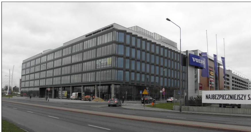
Fot. 2. Biurowiec Malta House w Poznaniu, Realizacja [Żarska 2013] Phot. 2. Malta House office building in Poznan, Completion [Żarska 2013]

munikacyjnej z udziałem transportu ekologicznego, inwestor może ubiegać się o nadanie mu certyfikatu LEED 1 lub BREEAM 2 . Są to dwa najbardziej cenione wyznaczniki prośrodowiskowe, które podnoszą nie tylko jakość inwestycji, ale także jej wartość rynkową [Jackowska 2012].