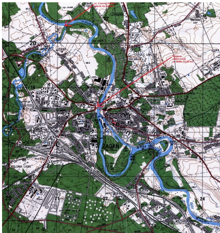
Rys. 1. Rzeka Bóbr i jej największy w granicach Żagania dopływ Czarna Wielka Fig. 1. Bóbr and its largest within Żagania supply Czarna Wielka

Powierzchnia zlewni częściowej wynosi tu 4254,0 km 2 (rys. 1).