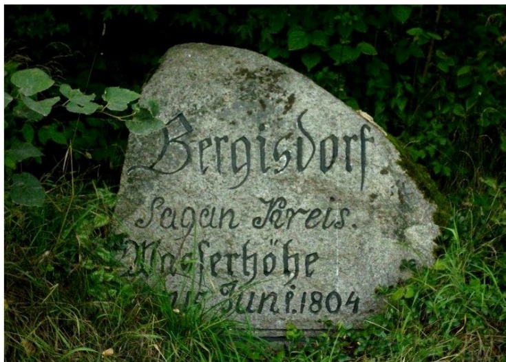
Fot. 1. Znak wielkiej wody w okolicach Żagania Phot. 1. Sign of large water in surroundings of Żagań

Na zebranie dokładniejszych informacji o rozmiarach powodzi pozwoliły dopiero rozpoczęte na początku XIX wieku systematyczne obserwacje stanów wody. Według danych IMGW-PIB we Wrocławiu [Piskalska 2014], na Bobrze wielkie powodzie występowały w latach 1880, 1897 i 1900. Największą powodzią, jaka zwróciła uwagę całego świata ze względu na poczynione spustoszenia - głównie w górnym biegu rzek górskich - była powódź w lipcu 1897 roku. Spowodowały ją wyjątkowo intensywne opady deszczu. W Karkonoszach w ciągu 36 godzin spadło wówczas od 255 mm na Śnieżce, 342 mm w Obřim Dole, a 345 mm w Zielonych Łąkach. Skutkiem tych opadów był ogromny wylew Bobru i Kwisy [Dubicki i in. 1997]. W ostatnich 60 latach największe wezbrania opadowe odnotowano w roku: 1958, 1977, 1981 i 1997 (rys. 2). W latach 1977 i 1997 powodzie spowodowały dwie fazy opadu i dwa wezbrania. Na początku XXI wieku, w latach 2001, 2002, 2006, 2010 i 2013 intensywne nawalne opady spowodowały kolejne gwałtowne wezbrania i katastrofalne lokalne powodzie w dorzeczu Bobru.