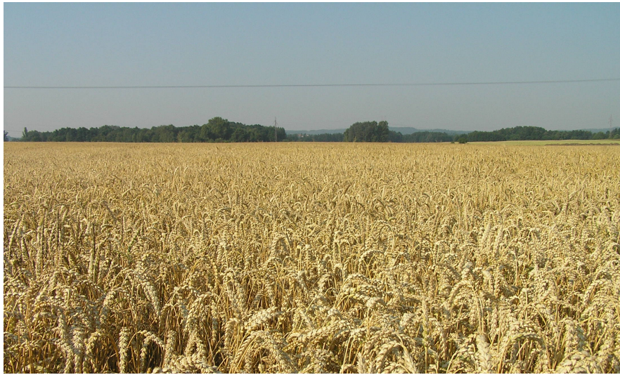
Fot. 1. Uprawa pszenicy jarej – Brzeg Głogowski, 2015 Phot. 1. Spring wheat cultivation – Brzeg Głogowski, 2015

Metale skumulowane w glebach tego obszaru w przypadku braku stosowania właściwych zabiegów agrotechnicznych, zwłaszcza w przypadku zaniechania regularnego wapnowania gleb mogą jednak nadal stanowić potencjalne zagrożenie ekologiczne. Spadek pH gleb uruchamia metale ciężkie i powoduje ich przepływ z fazy stałej gleby do roztworu glebowego. Metale stają się wówczas łatwiej dostępne dla roślin będących drugim ważnym ogniwem w łańcuchach troficznych: gleba → roślina → zwierzę → człowiek.