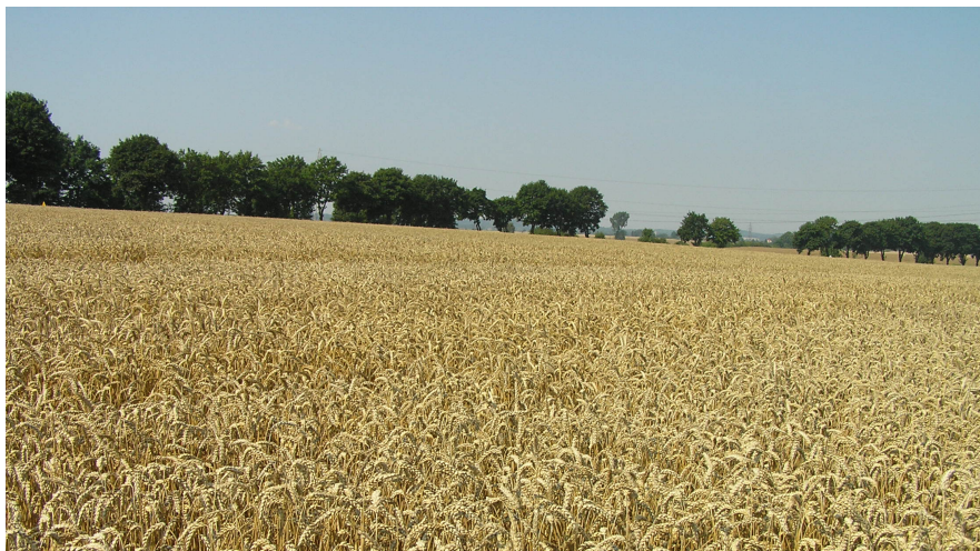
Fot. 2. Uprawa pszenicy ozimej – Żukowice, 2015 Phot. 2. Winter wheat cultivation – Żukowice, 2015

metali ciężkich dla roślin uprawianych w rejonach uprzemysłowionych. Wapnowanie gleb przez rolników wydaje się odpowiednim zabiegiem remediacji i immobilizacji pierwiastków w glebach, z punktu widzenia technologicznego i ekonomicznego. Stosowanie w procesach remediacji materii organicznej (biowęgiela, węgla brunatnego, osadów ściekowych), w celu zwiększenia zdolności sorpcyjnej i immobilizacji metali ciężkich w glebach, nie jest jeszcze do końca poznane i wiąże się z ogromnymi kosztami i trudnościami przy wykonywaniu tego zabiegu [Cuske i Karczewska 2016].