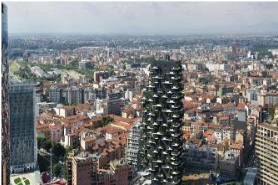
Fot. 6. Wertykalny las w Mediolanie

Zieleń wykorzystywana jest również jako materiał służący rewitalizacji oraz narzędzie łagodzące skutki urbanizacji. Przykładem takiego zastosowania zieleni jest Vertical Forest, zrealizowany w ramach rewitalizacji historycznej części Mediolanu (najbardziej zanieczyszczonego miasta świata). Ten 1-y na świecie pionowy las stał się wzorem dla zrównoważonego budownictwa mieszkaniowego. Na ok. 9.000 m 2 tarasów posadzono drzewa i inne rośliny, redukujące smog.