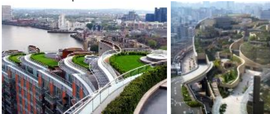
Rys. 3. Zielony dach: a) New Providence Wharf, Londyn, GB [ http://www.zinco-green-roof.com ], b) Namba Park, Osaka, Japonia [ inhabitat.com ]

Dachy zielone intensywne (także pół-ekstensywne) są dostępne do użytku dla ludzi. Polecane są w przypadku dachów użytkowych zazwyczaj w atrium budynków komercyjnych i mieszkalnych, jak np. obiekt w Londynie czy Osace. (Rys.3) Pierwszy z nich to New Providence Wharf (2004r.) o powierzchni ok.3000m 2 zielonych dachów, z trawnikiem i małym basenem na każdym poziomie tarasu. Drugi to Namba Park (2003r.), centrum handlowe z ośmiopiętrowym ogrodem na dachu oraz wodospadami.