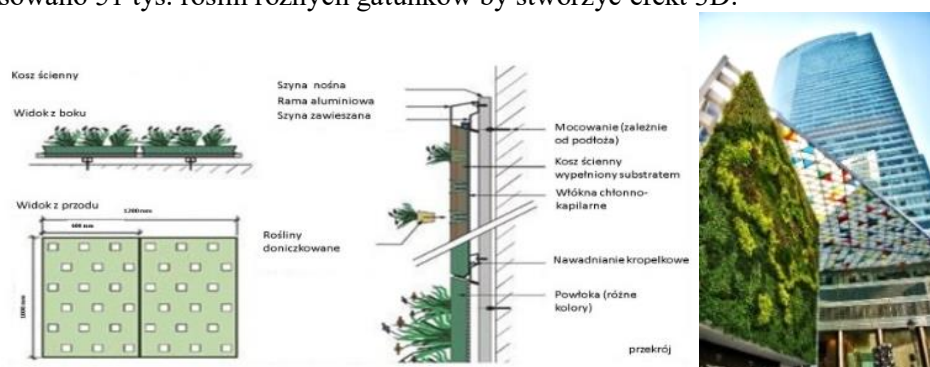
Rys. 4. Zielona ściana-schemat [http://www.dachyplaskie.info.pl/], zielona ściana Ocean Financial Centre, Singapur [https://www.skyrisegreenery.com]

Jedną z ciekawszych realizacji „living wall” jest w Singapurze, gdzie zastosowano 51 tys. roślin różnych gatunków by stworzyć efekt 3D.