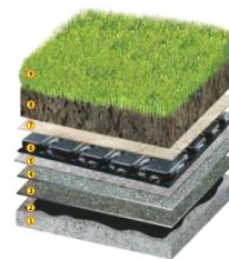
Rys. 1.Dach zielony (od lewej) ekstensywny i intensywny

Intensywny 1-podłoże betonowe, 2-impregnat asfaltowy, 3-papa zgrzewalna podkładowa, 4-papa zgrzewalna odporna na przerażanie przez korzenie roślin, 5-mata izolacyjno-ochronna, 6-mata drenażowa, 7-włóknina filtracyjna, 8-warstwa wegetacyjna-substrat o grubości odpowiedniej dla danego rodzaju roślin, 9-strefa roślin:trawy, byliny oraz krzewy i małe drzewa (wymagany większy nasyp substratu)