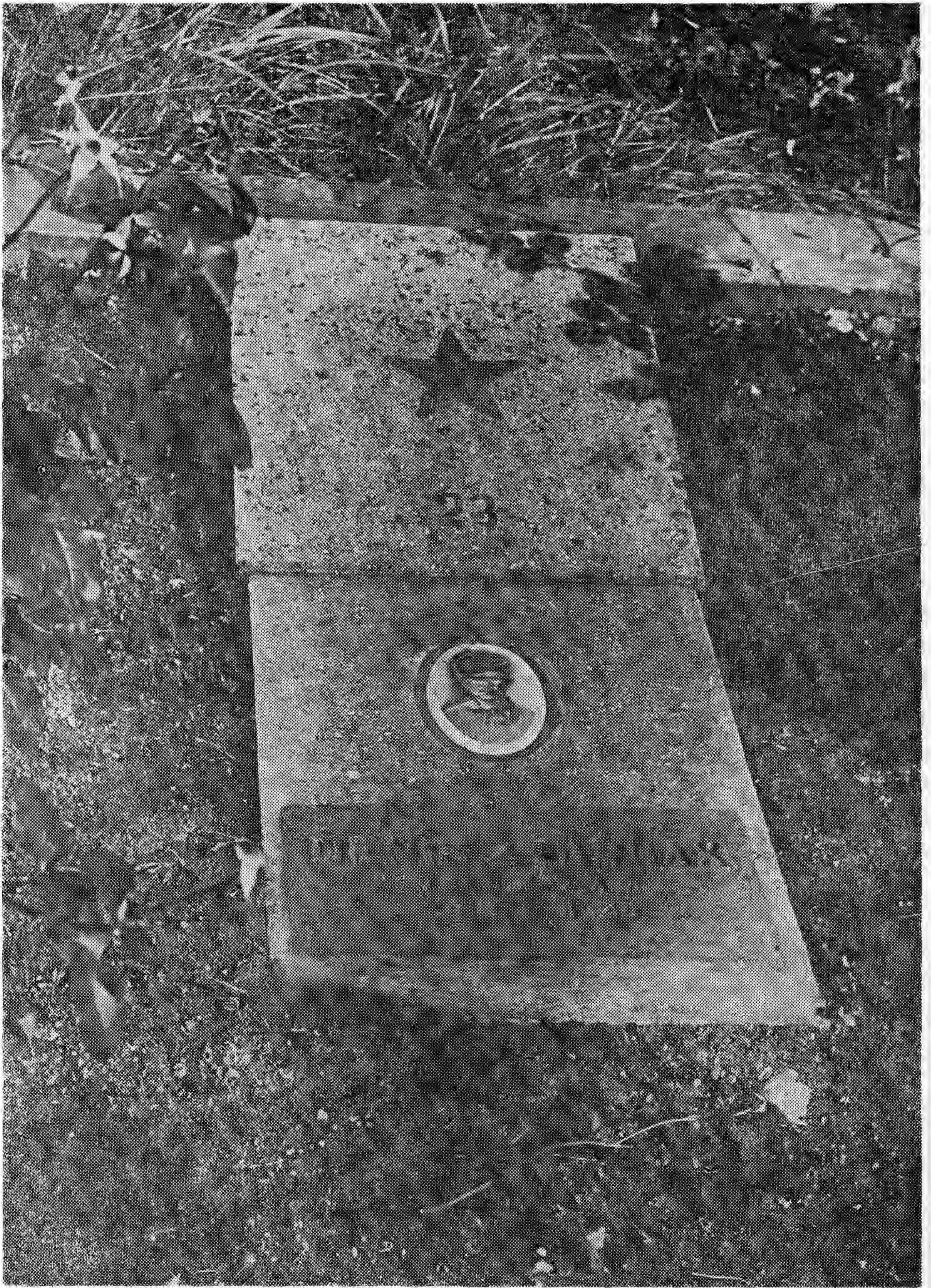
19. Krosno Odrzańskie, Mogiła żołnierska