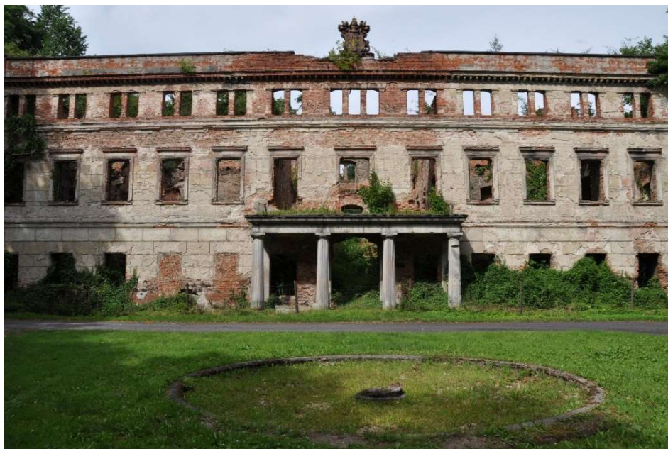
Fot. 5 Pałac w Zatoniu. Elewacja frontowa. Stan obecny, [Eckert 2016] Phot. 5. The palace in Zatonie. The front elevation. Present condition. [Eckert 2016]