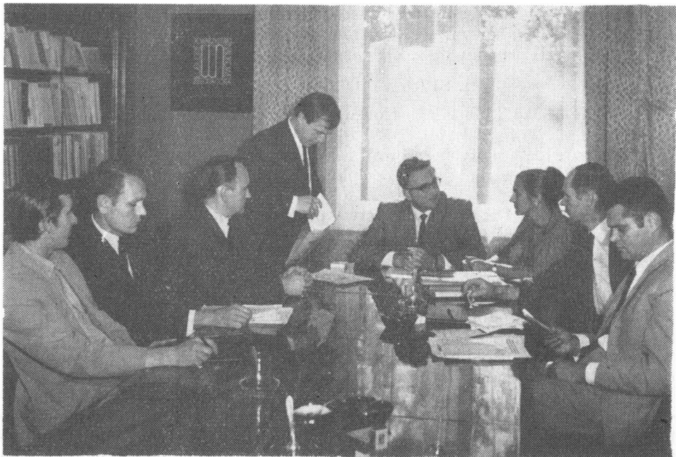
Posiedzenie zespołu autorskiego

Nadając kształt organizacyjny społecznemu ruchowi naukowemu mieliśmy nadzieję, że wszystkie dotąd podejmowane badania, jak np. w Muzeum Okręgowym — badania archeologiczne, w Polskim Towarzystwie Historycznym — badania odsłaniające przeszłość Ziemi Lubuskiej i wszystkie inne niezorganizowane, wraz z powstaniem Lubuskiego Towarzystwa Naukowego znajdują w jego ramach właściwe kierunki do pracy naukowej.