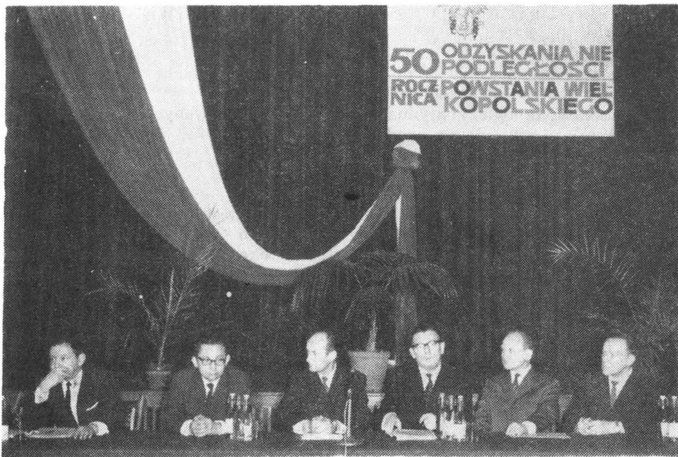
Prezydium sesji naukowej

W grudniu (7 i 13) 1968 roku odbyły się dwie sesje naukowe. Pierwsza z nich poświęcona była „50-leciu odzyskania niepodległości przez Polskę oraz 50 rocznicy Powstania Wielkopolskiego”.