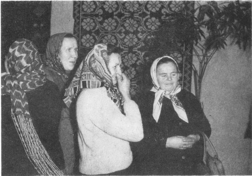
Uczestniczki sympozjum, mieszkanki lubuskich wsi, twórczynie ludowe