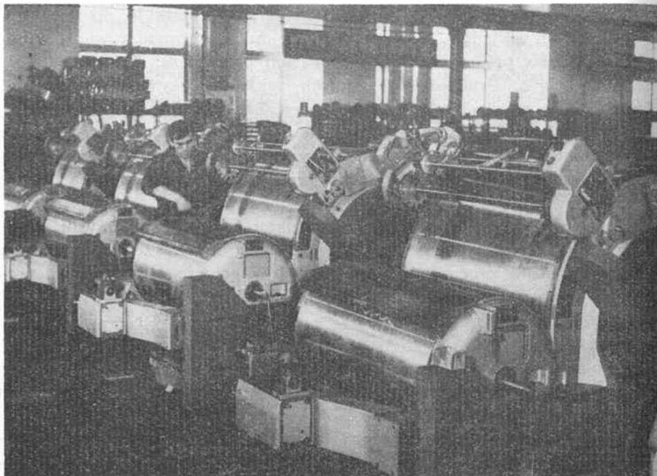
Lubuska Fabryka Zgrzeblarek Bawełnianych w Zielonej Górze

Ceramiki Budowlanej w Gozdniczy, Gorzowskich Zakładach Włókien Sztucznych, Lubuskich Zakładach Tkanin Dekracyjnych i Dywanów, Gubińskich Zakładach Obuwia, Fabryce Maszyn Budowlanych w Jasieniu, Lubuskiej Fabryce Zgrzeblarek Bawełnianych, Dolnośląskich Zakładach Metalurgicznych w Nowej Soli.