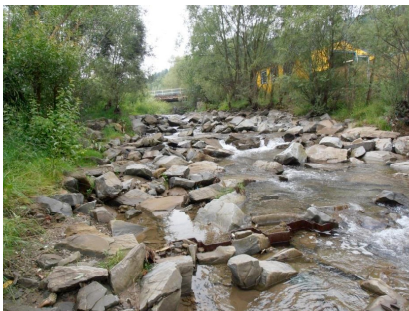
Rys. 1. Bystrze o zwiększonej szorstkości na potoku Poniczanka Fig. 1. Block ramp on the Poniczanka Stream

W ujściowym odcinku potoku wykonano regulację koryta rzecznoego za pomocą 10-ciu bystrzy o zwiększonej szorstkości. Wybrane do analizy bystrze o zwiększonej szorstkości znajduje się w 3+469 km rzeki (rys. 1). Głównym elementem jest płyta spadowa zbudowana z kamienia łamanego o długości 24 m i spadzie 2 m, stąd jej nachylenie wynosi 1:12. Szerokość budowli wynosi 10 m [Darczuk 2013]. W wyniku przejścia w 2014 roku fali wezbraniowej, doszło do obniżenia dna stanowiska dolnego o h_{\max} = 0,75 m.