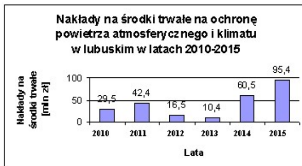
Rys. 2. Nakłady na środki trwałe służące ochronie powietrza atmosferycznego i klimatu w województwie lubuskim w latach 2010-2015 (ceny bieżące)[GUS 2011- 2016b]

Poziom nakładów na środki trwałe służące ochronie powietrza atmosferycznego i klimatu w Lubuskim w latach 2010-2015 zmieniał się w dość szerokim zakresie co pokazano na rysunku 2. Najniższe nakłady poniesiono w 2013 (10,4 mln zł) ale od tego roku zauważa się znaczny wzrost wydatków na ochronę atmosfery do 95,4 mln zł w 2015 r.