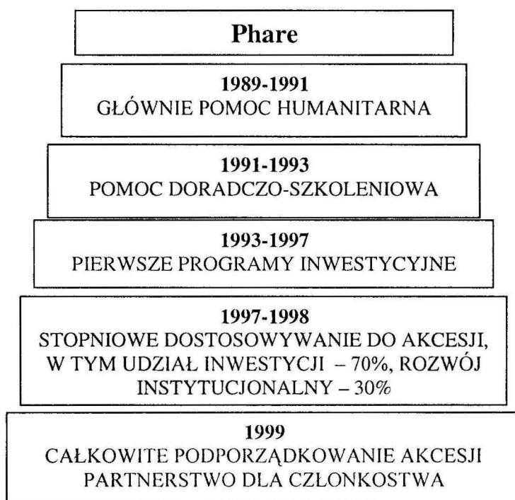
Rys. 1. Pomoc w ramach Phare w Polsce w latach 1989-1999

wraz ze zmieniającą się sytuacją międzynarodową i umacnianiem systemów demokratycznych i zasad gospodarki rynkowej w krajach Europy Środkowej i Wschodniej. Środki pochodzące z tego programu zaczęto przeznaczać na finansowanie szkoleń, doradztwa oraz studiów i ekonomicznych analiz sektorowych. W 1993 roku uruchomiono w ramach Phare pierwszy program inwestycyjny o charakterze regionalnym – program Phare STRUDER. Ponad 80% środków programu zostało przeznaczonych na bezpośrednie dofinansowanie inwestycji produkcyjnych polskich małych i średnich przedsiębiorstw oraz inwestycji w zakresie infrastruktury gminnej. W jego ramach utworzono również dwa fundusze venture capital oraz fundusz gwarancyjny. Począwszy od roku 1997 pomoc w ramach Phare w coraz większym stopniu koncentruje się na projektach przyspieszających integrację europejską.