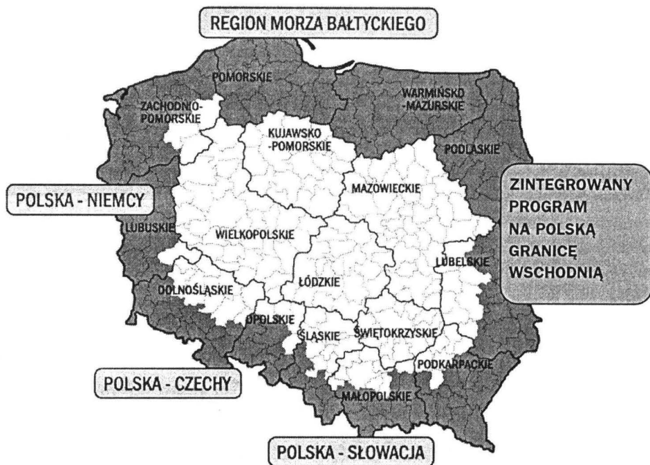
Rys. 2. Program Współpracy Przygranicznej Phare CBC

wszystkie polskie euroregiony w ramach tzw. małych projektów euroregionalnych 23 oraz jedenaście z szesnastu województw: dolnośląskie, lubuskie, zachodniopomorskie, pomorskie, warmińsko-mazurskie, podlaskie, lubelskie, podkarpackie, małopolskie, śląskie, opolskie 24 .