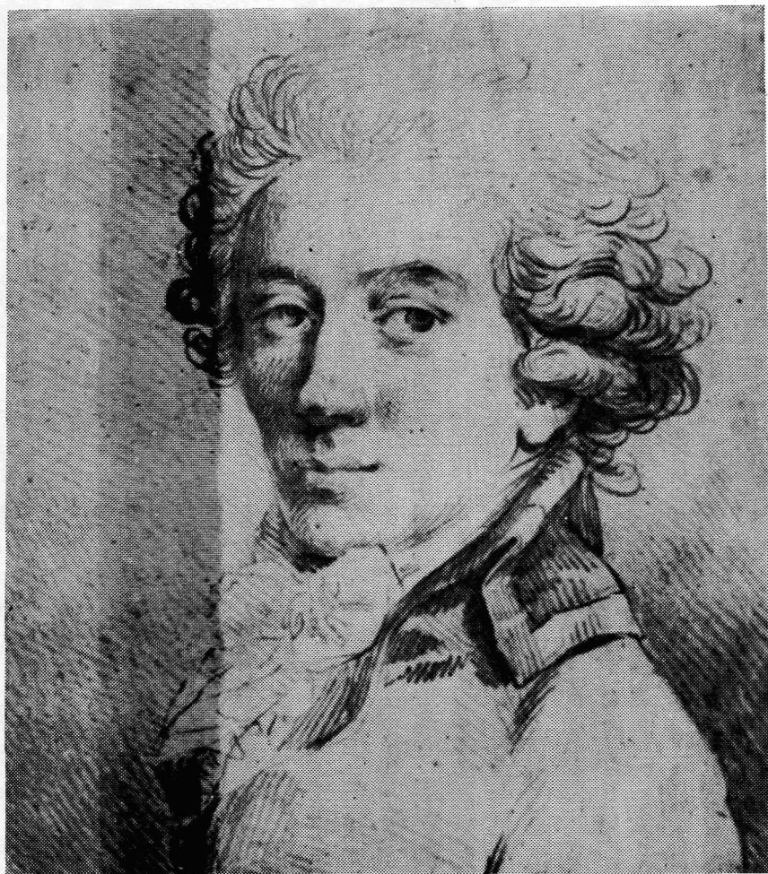
Fot.3. J. Grassi , Rysunek przygotowawczy do portretu Stanisława Kostki Potockiego (Gł. Ryc. Biblioteki PAN im. Ossolińskich we Wrocławiu). J. Ruszczyćówna , Portrety polskie Józefa Grassiego, "Biuletyn Historii Sztuki", R.1954, nr2.

wojenne, czy też godność wojskową modela, ujawnia się tendencja do idealizacji, heroizacji, dodawania natchnionego wyrazu twarzy portretowanej osoby 8 .