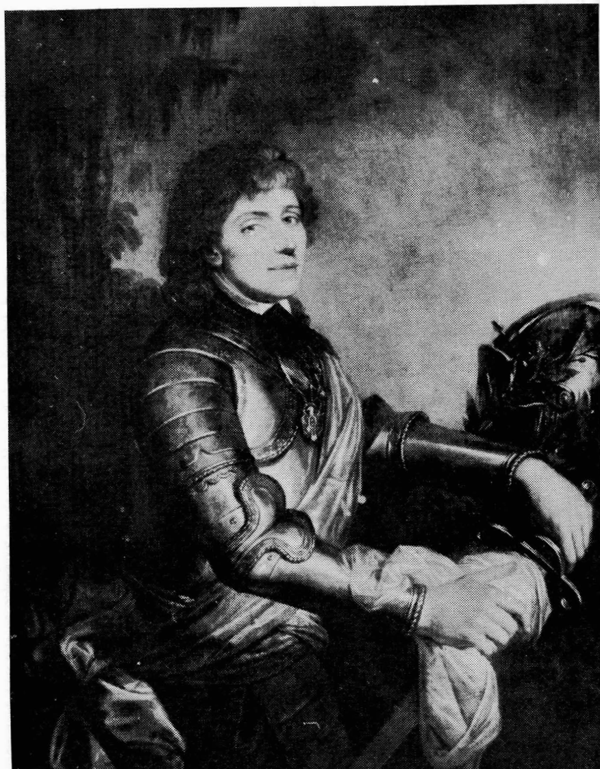
Fot. 4. J. Grassi, Portret Tadeusza Kościuszki. Portrety polskie, pod. red. J. Mycielskiego, Lwów, t. 1, z. 2.