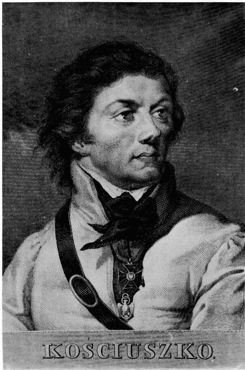
Fot. 7. A. Oleszczyński, Portret Tadeusza Kościuszki.

F. Konieczny, Tadeusz Kościuszko: na setną rocznicę zgonu Naczelnika. Życie - Duch - Czyn. Warszawa 1917.