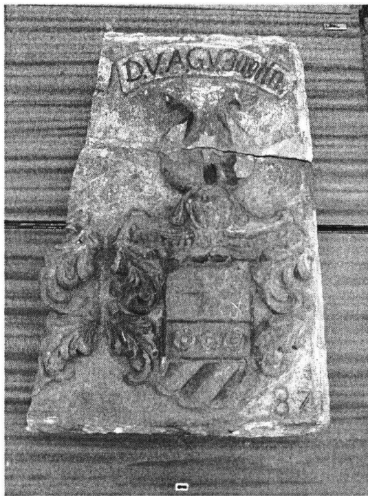
Fot. 1. Fragment płyty z herbu von Jeuthe

Jak odbiły się te wydarzenia na całej rodzinie, możemy jedynie domniemywać. Matka – Dorotea, zmarła 20 lat później – 17 stycznia 1683 roku, w wieku 66