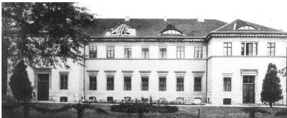
Pałac w Cybince – elewacja wschodnia. Stan sprzed 1939 roku (Reprodukcja wg H. Schmitz, Berliner Baumeister vom Ausgang des achtzehnten Jahrhunderts , Berlin 1925).

Zamieszczone w tekście ilustracje pochodzą z pracy R. Linette, Pałac w Cybince, dokumentacja historyczno-architektoniczna , Poznań 1970 (PSOZ w Zielonej Górze, mnpis), il. 6, 53.