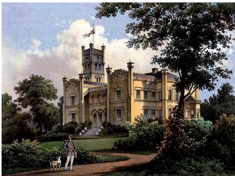
Ryc. 3. Pałac w Luboszycach na kolorowej litografii Alexandra Dunckera XIX w.