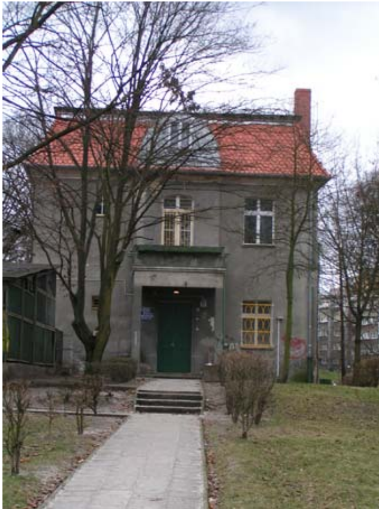
Fot. 6. Dawny dom winiarski Winklana przy ul. Krasickiego 25 (stan obecny).

z charakterystyczna dla domów winiarskich z tego okresu.