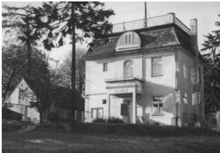
Fot. 5. Dawny dom winiarski przy ul. Krasickiego 25.

wzniesiony został około połowy XIX wieku z cegły na planie kwadratu. Początkowo pełnił funkcje gospodarcze, a centralnie umieszczone pomieszczenie wykorzystywano na świętowanie winobrania – rozpięto nad nim kopułę (w konstrukcji pozornej kopuły), zdobioną polichromią z dekoracją w postaci motywów roślinnych i putt 9 . Oględziny poddasza, nakrytego wysokim mansardowym dachem, ujawniły interesujące szczegóły konstrukcji. Więźba dachowa oparta została częściowo na murze zewnętrznym, częściowo zaś na czterech ceglanych łukach, wspartych na zewnętrznych ścianach nośnych i zbiegających się półkoliście w punkcie centralnym, tworząc podstawę komina. Przewody kominowe ukryto we wnętrzu dwóch łuków, posiadających u nasady komina drzwiczki wycierowe. Do więźby dachowej podwieszono na stalowych linkach konstrukcję pozornej kopuły, którą uzyskano obrzucając zaprawą z obu stron stalową siatkę. Grubość powstałego w ten sposób sklepienia wynosi ok. 5 cm 10 . Budynek został w części podpiwniczony. Ze wszystkich stron obudowano go parterowymi aneksami nakrytymi daszkami pulpitowymi, nad którymi góruje dach mansardowy nad częścią centralną. Zastąpiły one dawną drewnianą przeszkloną werandę, okalającą budynek z trzech stron. Przekształceniu uległy okna i drzwi. Poza profilowanym gzymsem wieńczącym elewacje nie zachowały się dawne podziały architektoniczne. Pomimo późniejszych zmian czytelna pozostaje bryła budynku