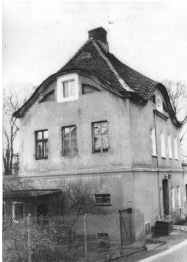
Fot. 4. Dawny dom winiarski przy ul. Pięknej 20 (stan obecny).

sadę akcentuje skromny ganek. Budynek uległ znacznym przeobrażeniom po 1945 roku: w trakcie prowadzonych remontów zlikwidowano wystrój architektoniczny i pokryto elewacje grubą warstwą cementowego tynku, usunięto też balustradę dawnego tarasu widokowego, wymieniono stolarkę i przebudowano wnętrza. Z oryginalnego wyposażenia zachowały się jedynie drewniane schody zabiegowe z drewnianą ażurową balustradą.