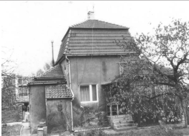
Fot. 7. Dawny dom winiarski przy ul. Zakręt 2.

Nieopodal (ul. Urszuli 9) zachował się dom winiarski, wybudowany na początku XIX wieku na planie kwadratu, nakryty wysokim dachem namiotowym. Położony był w otoczeniu winnic na zboczu opadającym w kierunku Doliny Luisy. Obecnie teren ten uległ daleko posuniętej degradacji.