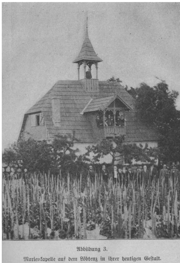
Fot. 1. Dawna kaplica Maryjna jako dom na winnicy z końca XIX wieku.

nymi okiennicami. Budynek dostępny jest od wewnątrz, od strony lokalu gastronomicznego. Piwnicę adaptowano na bar, zaś na wyższej kondygnacji znajdują się pomieszczenia biurowe.