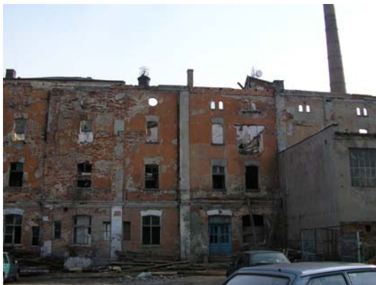
Ryc. 5. Elewacja frontalna zachodnia budynku słodowni. Stan obecny.

kątnych otworach, zamkniętych łukiem odcinkowym. Dodatkowo okna na parterze miały szerokie, proste opaski, natomiast na piętrze mieściły się okna w większym rozmiarze i zaopatrzone w drewniane okiennice. Budynek o rozbudowanym gzymsie koronującym posiadał spadzisty dach pokryty papą. Fasadę fermentowni i chłodni na wysokości parteru przysłaniają pomieszczenia leżakowni. Zabudowania te, o rzucie prostokąta, przylegają do wyżej omawianego obiektu krótszą, wschodnią ścianą. Ten jednokondygnacyjny obiekt, przykryty dachem spadzistym, posiada analogiczne do budynku fermentowni i chłodni opracowanie elewacji. Zasadniczym akcentem elewacji jest więc układ lizen i pasu pod gzymsem. Według projektów elewacja zachodnia posiadała sześć osi 18 . Okna, tak jak w wyżej opisanych budynkach, miały kształt zbliżony do prostokąta i zamknięte były łukiem odcinkowym. W trzeciej części, od północy, funkcjonowały dwuskrzydłowe drzwi, założone w 1883 roku. Elewacja północna dzieliła się na cztery części o podwójnych oknach, natomiast elewacja południowa była pozbawiona otworów okiennych. Od strony północnej istniała wiata o drewnianych słupach. W pierwotnych planach elewacja zachodnia leżakowni miała być jedynie czteroczęściowa, nie uwzględniono także po tej stronie otworu drzwiowego. W latach dwudziestych XX wieku rozbudowano pomieszczenia