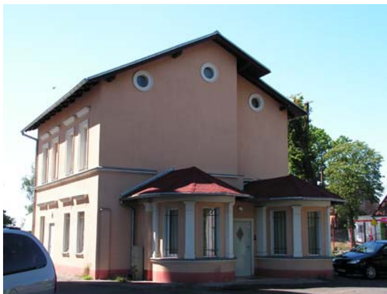
Ryc. 6. Budynek dawnej portierni w widoku od północnego-zachodu. Stan obecny.

Kilka lat temu obiekt został poddany gruntownemu remontowi. Odstępstwem od pierwotnego zarysu bryły jest dobudowany drugi półkolisty wykusz na północno-zachodnim narożniku.