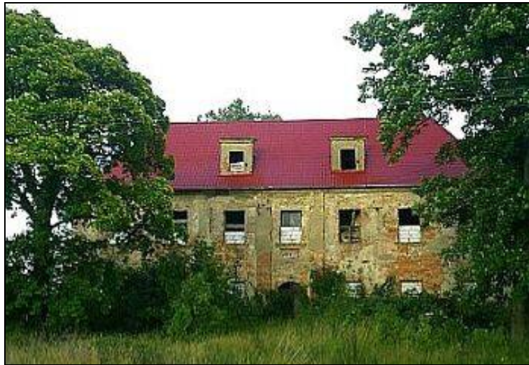
Ryc. 3. Dwór w Borowinie.

Dwór w Borowinie (Ryc. 3) zbudowano w połowie XVI wieku. Budynek zwrócony był fasadą na zachód, murowany z kamienia i cegły, dwukondygnacyjny, założony na rzucie prostokąta. Wejście prowadzi przez kamienny, dwuprzęsłowy most przerzucony przez pierwotnie nawodnioną, a obecnie suchą, fosę otaczającą budynek. Dwór był kilkakrotnie rozbudowywany. Do najstarszych skrzydeł – północnego i zachodniego – w drugiej połowie XVI wieku dobudowano południowe, w XVIII – wschodnie skrzydło 12 . Wszystkie części budynku są tej samej wysokości, skupiają się wokół dziedzińca z krużgankami.