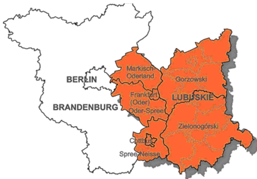
Rysunek 1. Obszar wsparcia środkami Inicjatywy Wspólnotowej Interreg IIIA Polska (województwo lubuskie) – Brandenburgia.