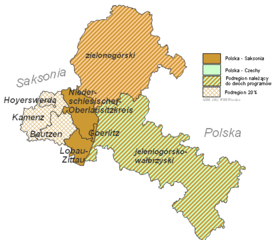
Rysunek 3. Program współpracy transgranicznej – Polska (województwa lubuskie, dolnośląskie) – Kraj Związkowy Saksonia realizowany w latach 2007–2013.

część województwa lubuskiego – projekty o charakterze infrastrukturalnym realizowane będą na obszarze dwóch powiatów, tj. żagańskiego i żarskiego.