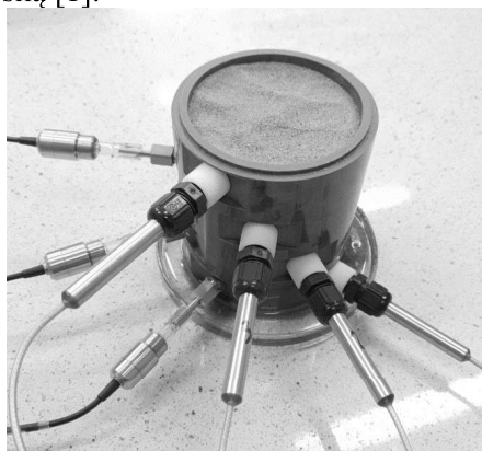
Rys.2. Kolumna gruntowa z sondami wprowadzonymi w próbkę piasku na czterech poziomach wysokości. Fig.2. A soil column with probes inserted into the sand sample at four height levels.

Eksperyment z pomiarami wilgotności dla piasku przeprowadzono z wykorzystaniem czterech poziomów tzw. kolumny gruntowej (rys. 2). Pomiar odbywa się w trakcie podciągu wody przez grunt ponad jej lustro. Piasek został przesiany przez sito 0 - 1 mm. Jego próbka została wsypana do kolumny gruntowej i zagęszczona niewielką siłą [1].