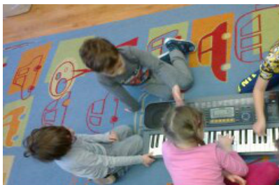
Rozmowy przy instrumentcie

zorganizowanie w przedszkolu studia nagrań, poznanie warsztatu pracy realizatora oraz artysty. Dla celów innowacji przygotowano autorskie aranżacje podkładów do kolęd, dostosowane do możliwości wykonawczych dzieci. Na pamiątkę każde dziecko otrzymało płytę CD z nagraniem kolędami: Hej, w dzień narodzenia, Kaczka pstra, Lulajże Jezuniu, Anioł pasterzom mówił, Przybieżeli do Betlejem pasterze.