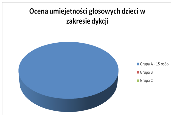
Wykres 2. Ocena umiejętności głosowych dzieci w zakresie dykcji (badania własne)

Uzyskane wyniki dowiodły, że kompetencje wokalne dzieci nie rozwijają się na równym poziomie. Przyrost umiejętności poprawnego śpiewu w największym stopniu przypada na wiek 7–8 lat, co stanowi 60% badanych dzieci. 27% to dzieci w wieku 9–10 lat, które miały małe trudności z zaśpiewaniem czyśto zapisanych nut lub też interwału w danej piosence. Dzieci w wieku 11–12 lat to grupa, w której najczęściej pojawiały się błędy intonacyjne, harmoniczne, dykcyjne (stanowiło to 13% badanych).