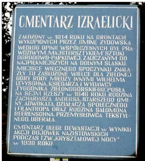
Die Gedenktafel in Blau-Weiß trägt die Überschrift: Cmentarz izraelicki (Israelitischer Friedhof) . (2003 r.).