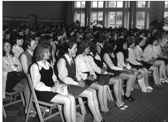
Inauguracja 1971 r.